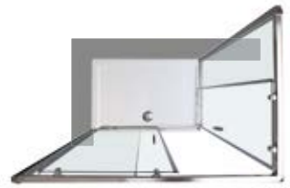
Versione angolare SX Left corner version