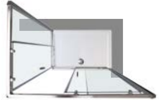
Versione angolare DX Right corner version