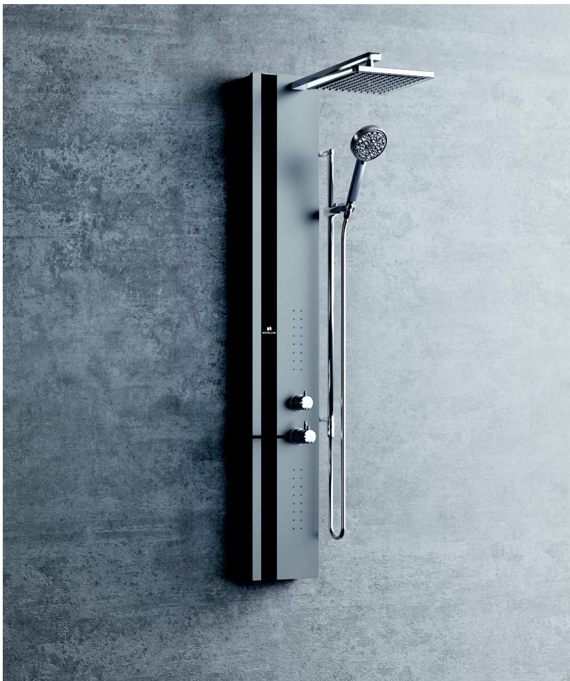
Soffione 200x200 mm

COLONNA ATTREZZATA IN VETRO ED ALLUMINIO CON SOFFIONE, INSTALLABILE A PARETE DESIGN MARCO PELLICI