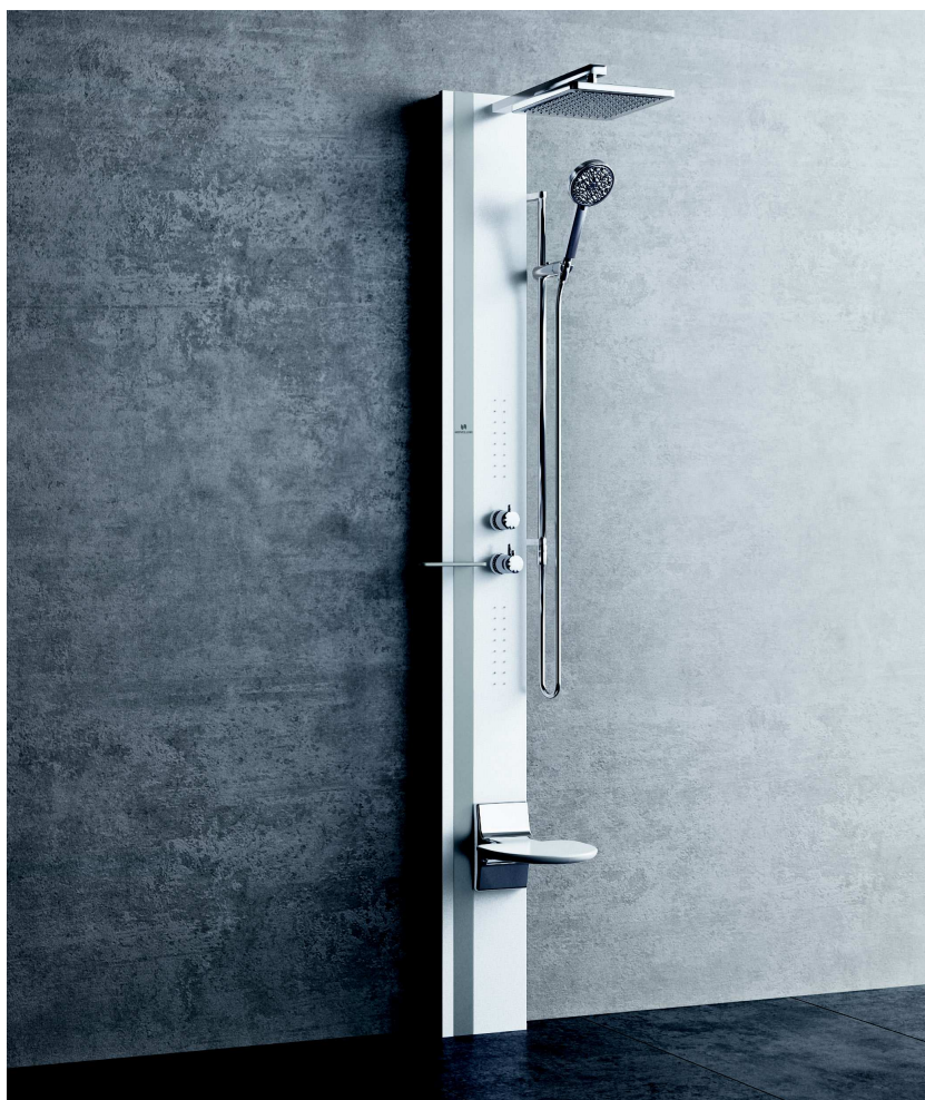
Soffione 200x200 mm

COLONNA ATTREZZATA IN VETRO ED ALLUMINIO CON SOFFIONE, INSTALLABILE A PARETE DESIGN MARCO PELLICI